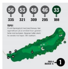
Flere utslagsområder foran