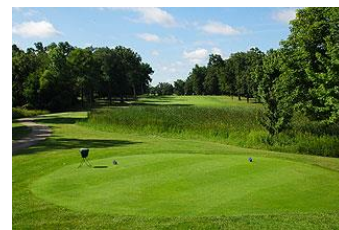
Dårlig eksempel med straffeområde rett utslagsområdet