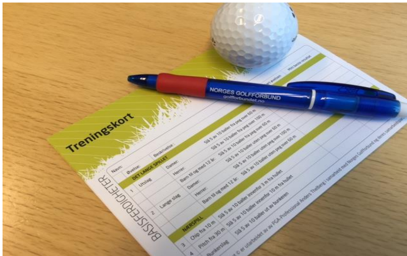
Treningskortet, kursets jukselapp for både trenere og kursdeltakere

Treningskortet danner grunnlaget for kurset. Kursdeltakeren og trenerne skal kunne bruke kortet som en sjekkliste i løpet av kurset og som en veileder i egen aktivitet og opplæring. Treningskortet tar for seg basisferdigheter i trening og spill, samt basiskunnskaper .