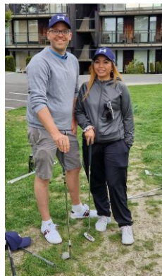
Tross uføre – ut i jobb!