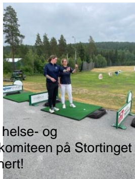
Leder av helse- og omsorgskomiteen på Stortinget ble imponert!