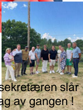
Statssekretæren slår Ett slag av gangen !