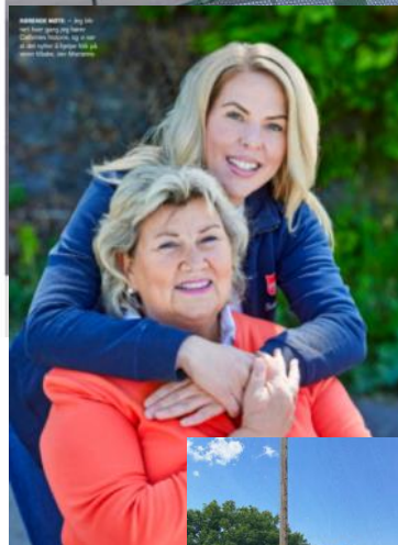
...llen, selv etter kort tid. Det viktigste for henne er uansett at hun er tenforskap. Blant annet gjennom «Ett slag av gangen».