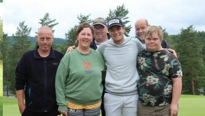
ESAG deltakere på Kongsvinger GK møtte Hovland