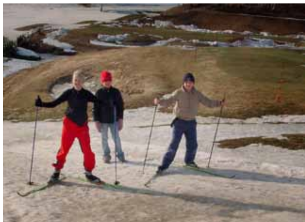
Sommer og vinter på en og samme plass på Oppegård GK.