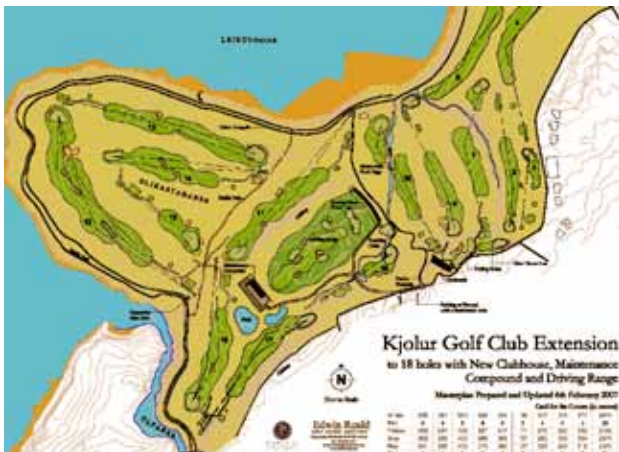
Tur- og ridestiene på Kjölur GC gjør den vakre Blikastadanes-halvøya tilgjengelig for alle.

Om høsten er det dragefestival. Da løper mange mennesker rundt på jordene med fargerike og flygende kreasjoner. Om vinteren oppsøker skiløpere og akende barn golfbanen. Stiene rundt banen brukes av skoleklasser i København på den nasjonale friluftsdagen om høsten. Dessuten går det ridestier rundt og gjennom golfbanen som daglig blir brukt av ryttere fra nærliggende ridestaller. Golfbanens arealer er populære blant sopplukkere, ettersom det er lett å få øye på soppen i det kortklipte gresset. Mange fotografer besøker golfbanen – spesielt når kronhjorten er i brunst på senhøsten. I jaktseongen felles en del av dyrene, også på golfbanen, uten at spillere og jegere forstyrres av hverandre.