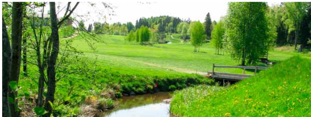
Natur- og kulturverdier ble kartlagt i et samarbeid mellom OPPEGÅRDS GK , STRI og NORGES GOLFFORBUND .

Her finnes et stort antall truede (rødlistede) planter, dyr og sopper. Enkelte finnes bare her i hele Norden. Til å begynne med var det ikke bare positive reaksjoner på en ny 18-hulls bane i det unike området. Men Kristianstads kommune og naturreservatet Kristianstads Vattenrike tenkte nytt: ”Det er bedre med en golfbane med tilpasset vedlikehold enn et industriområde” – og slik ble det. Kommunen gikk med på å selge tomten under forutsetning av at klubben arbeidet med miljøsertifisering av banene. Sammen med naturreservatet driver klubben nå et prosjekt finansiert av STERF med fokus på natur- og kulturverntiltak, informasjon og tilgjengelighet. Prosjektet er et godt eksempel på hvordan man