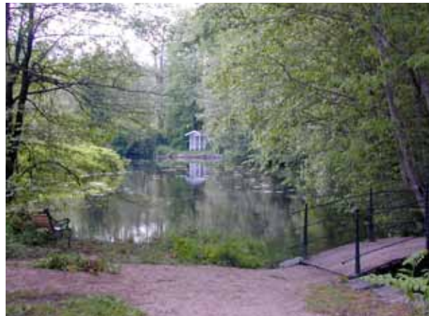
Verksdammen på Arendal & Omegn GK.

For å utvide golfbanen fra ni til atten hull trengte KJØLUR GC tilgang til et naturminneklassifisert område. I henhold til Islands nasjonale fortidsminneregister har området ca. 20 isolerte steder med arkeologiske levninger som man måtte ta hensyn til ved utformingen av den nye banen. Det ble ikke utført grunnarbeid innenfor en radius på tjue meter fra fortidsminnene.