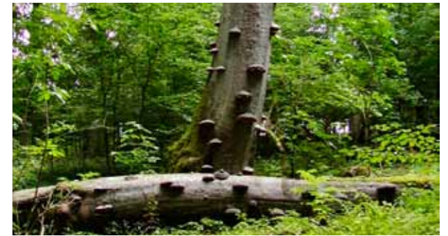
Golfbaner er et miljø der biotoper som småvann, dammer og dødt treverk kan gi truede arter nye livsmiljøer.