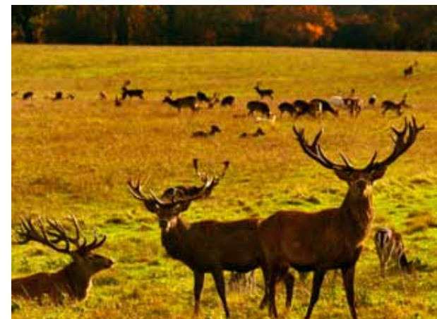
I Jægersborg dyrehave er det ikke bare aktive friluftsmennesker golferne må dele området med. Her finnes også 2000 kronhjorter som beveger seg fritt omkring.