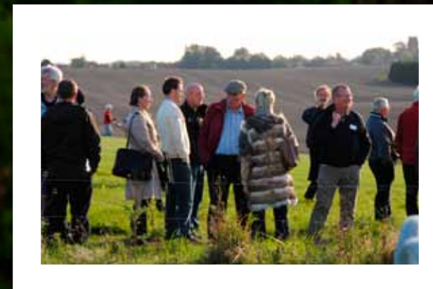
Representanter fra golfanlegg, myndigheter og organisasjoner fra hele Norden på studiebesøk på Smørum Golfcenter i forbindelse med konferansen om multifunksjonelle golfbaner i september 2010.

Slike samarbeid eksisterer allerede. I dette heftet beskriver vi noen av de nordiske golfanleggene som samarbeider på tvers av grensene for å øke tilgjengeligheten og det biologiske mangfoldet, og for å bevare sin kulturhistorie. Vi har også tatt med et inspirerende eksempel fra Nederland. Hvorfor ikke gjøre Norden til en foregangsregion når det gjelder multifunksjonelle golfanlegg og samarbeid mellom ulike grupper i samfunnet? Norden kan bli en pådriver for å integrere idrett og miljø i internasjonal sammenheng.