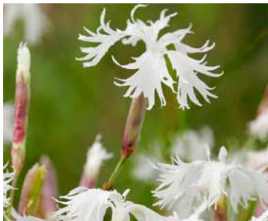
På KRISTIANSTADS GK i Åhus trives den sjeldne sandnelliken.

Her finnes et stort antall truede (rødlistede) planter, dyr og sopper. Enkelte finnes bare her i hele Norden. Til å begynne med var det ikke bare positive reaksjoner på en ny 18-hulls bane i det unike området. Men Kristianstads kommune og naturreservatet Kristianstads Vattenrike tenkte nytt: ”Det er bedre med en golfbane med tilpasset vedlikehold enn et industriområde” – og slik ble det. Kommunen gikk med på å selge tomten under forutsetning av at klubben arbeidet med miljøsertifisering av banene. Sammen med naturreservatet driver klubben nå et prosjekt finansiert av STERF med fokus på natur- og kulturverntiltak, informasjon og tilgjengelighet. Prosjektet er et godt eksempel på hvordan man