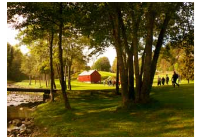
Jernverksmuseet arrangerer kulturhistoriske vandringer på Arendal & Omegn GK.

ARENDA & OMEGN GK s golfbane, Nes Verk Golfpark, er anlagt på grunn som ble disponert av Nes jernverk i årene 1665–1959. I forbindelse med byggingen ble det anlagt stier og satt opp skilt i samarbeid det lokale historielaget og Næs Jernverksmuseum. Museet arrangerer også kulturhistoriske vandringer på golfbanen. Golfklubben har laget fiske- og badeplasser ved elven som er i flittig bruk om sommeren. Om vinteren fungerer anlegget ypperlig til skigåing. Klubben preparerer skispor, hopp og akebakker i samarbeid med lokale idrettsforeninger og kommunen.