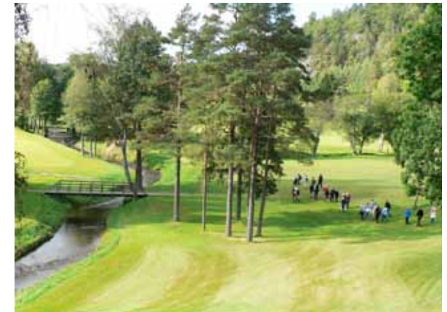
Synlige spor etter jernverkstiden på Nes Verk Golfpark.