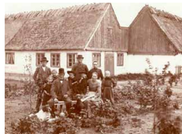
Kulturhistorien står i sentrum på Smørum Golfcenter.

På golfbanen finnes det åpne diker som viser hvordan landbruket så ut for ca. 300 år siden. Dikene er i dag et karakteristisk innslag på banen og et beskyttet